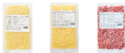
台湾レモン 8mm カットパイナップル 8mm カットストロベリー