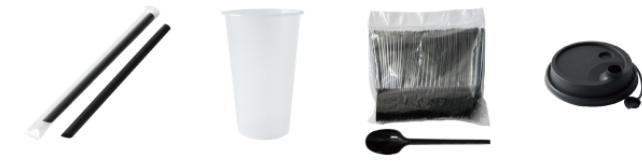
黒ストロー 18cm / 21cm