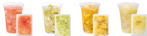
グレープフルーツ & ナタデココ 90g / 130g キウイフルーツ & ナタデココ 90g / 130g パイナップル & パッション & ナタデココ 90g / 130g パイナップル & ナタデココ 90g / 130g