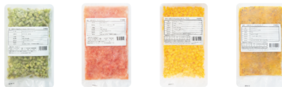
8mm カットキウイフルーツ グレープフルーツ 8mm カットマンゴーフルーツ パッションフルーツ