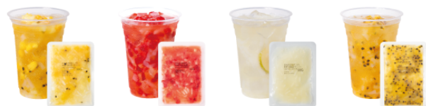
パイナップル & パッション & ナタデココ 90g / 130g ストロベリー & ナタデココ 90g / 130g 台湾レモン & ナタデココ 90g / 130g パッションフルーツ & ナタデココ 90g / 130g